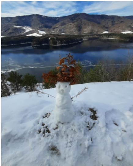
Strážca priehrady.