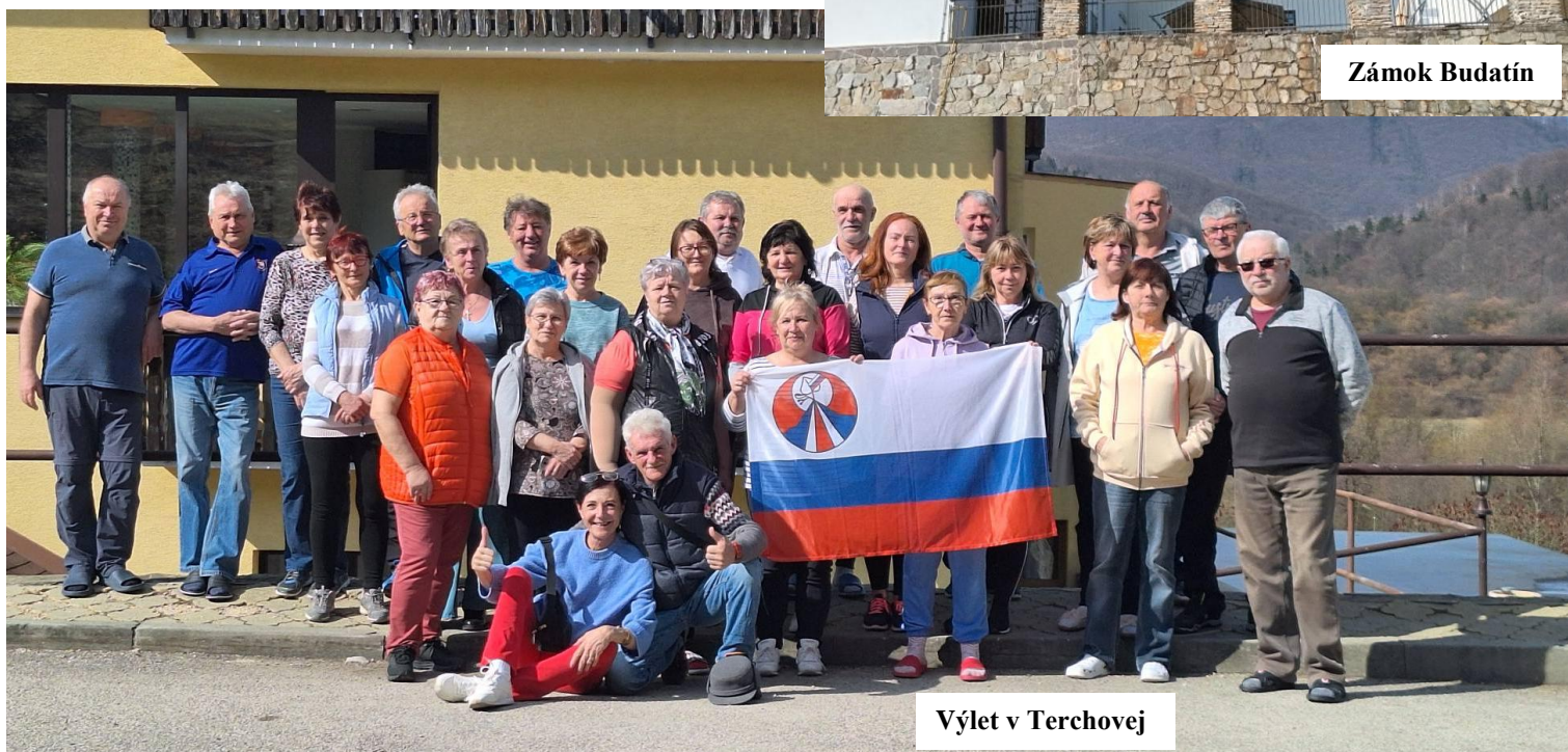
Výlet v Terchovej