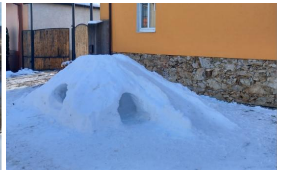
Snehový domček v Kinovej ulici pri rodinnom dome č. 346.