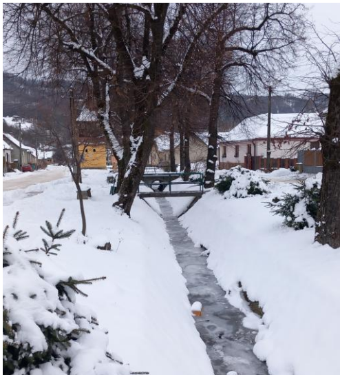
Lávkovský potok na Lipovej ulici.