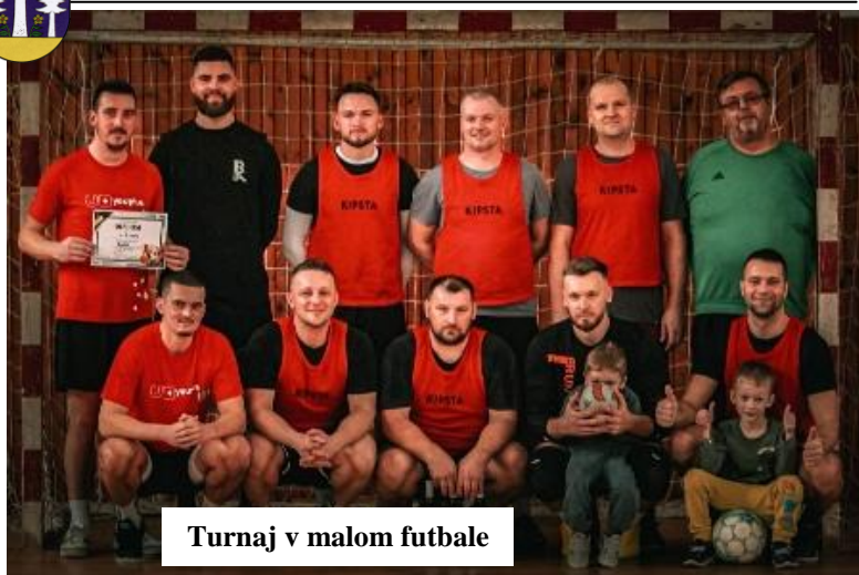
Turnaj v malom futbale

Séria športových podujatí vyvrcholila v nedeľu – 1. februára turnajom v stolnom tenise , kde účastníci predviedli svoju šikovnosť, presnosť a športového ducha.