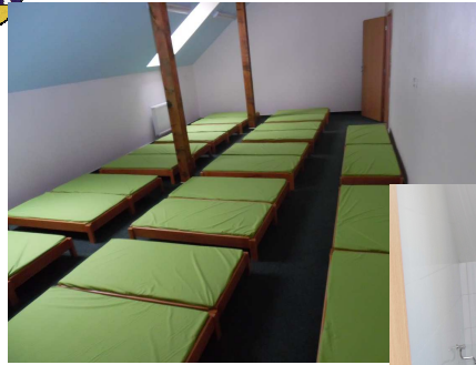
Naše nové postielky a sociálne zariadenie

veľmi pekná takže MŠ vyzerá ako nová. Do budúcnosti plánujeme dokončiť podkrovné priestory tak, aby všetky deti mali stabilnú spálňu a tety upratovačky nemuseli každý deň rozkladať a skladať ležadlá. Tiež by sme chceli, aby sa na dvore, kde sa hrajú naše ratolesti, zelenala pekná trávička a zdobili ho pekné