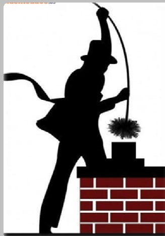
Ilustračný obrázok, zdroj internet