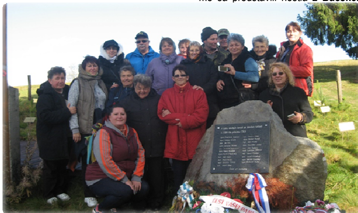
Turistický výstup ku prameňu Ipľa a návšteva pamätného miesta, kde v roku 1956 spadlo lietadlo a zahynulo 12 ľudí