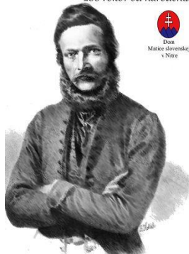
Dien Matica slovenskej v Nitre

svojimi „Štúrovcami“ bojoval aj o možnosť písať a čítať knihy v našom jazyku. A netreba sa vyhovárať na peniaze. Kedy ste boli naposledy v našej obecnej knižnici? Viete koľko zaujímavých kníh tam nájdete? Slovenčina je vraj