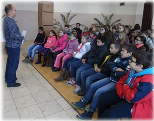
2015 ROK ĽUDOVÍTA ŠTÚRA 200 rokov od narodenia